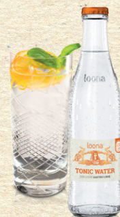
loona Gin Tonic